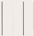
Sveiseledning 074210 - ABS 073411 - PP 071219 - HDPE 073114 - PVC