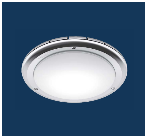
CONNECT S20 IK10-IP65 Vandalsikker

Hver eneste detalj er gjennomtenkt for å tilby best mulig ytelse og fleksibilitet i en rekke forskjellige miljøer. Dette gjør at kundene følger seg trygge på sine belysningsløsninger.