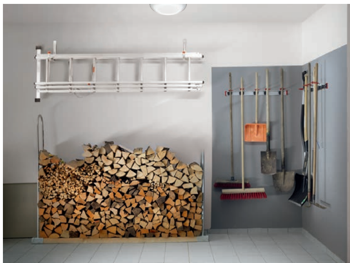
RS PRO PIR passer i innendørsmiljøer hvor man ønsker en designet armatur med IR-sensor i bod, garderobe, toalett, trapper, e.l.